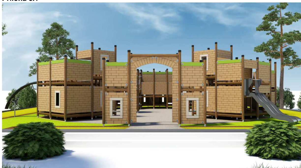
Príloha č. 2